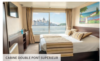
CABINE DOUBLE PONT SUPÉRIEUR